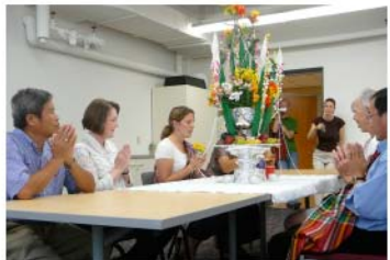
ພິທີບາສີລາວແລະມື່ງທີ່ອິນກຣາແຮມຮອນ