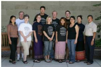
ນັກສຶກສາ ຫ້ອງຮຽນພາສາລາວ ປີ ໒໐໐໗