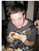
ຄຳ ຮຽນກິນ ຕີນໄກ່