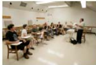
ອາຈານກິດ ກຳລັງສອນ