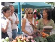
ນັກສຶກສາຊື້ຜັກ