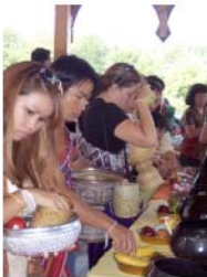
ນັກສຶກສາ ຊີອາຊີ ກໍາລັງ ເລີ່ມປາກ